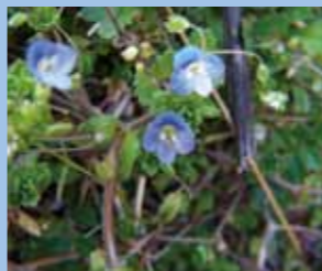
オオイヌノフグリ