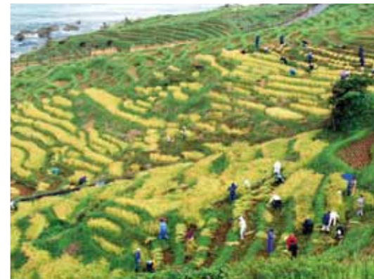
棚田での稲かり(石川県輪島市)

一枚一枚の田にうつる月は「田毎の月」とよばれ、日本の美しい風景の一つとされています。